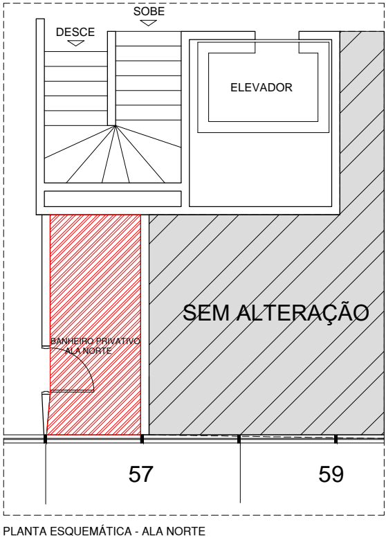
PLANTA ESQUEMÁTICA - ALA NORTE